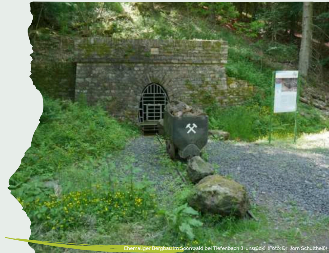
Ehemaliger Bergbau im Soonwald bei Tiefenbach (Hunsrück).

Der zweite Tag widmet sich der praktischen Auseinandersetzung mit dem Thema. In einer Exkursion erkunden wir ausgewählte Waldlandschaften vor Ort und besprechen Herausforderungen sowie Lösungsansätze, vor allem im Soonwald sowie im Weinbaugebiet Nahe.