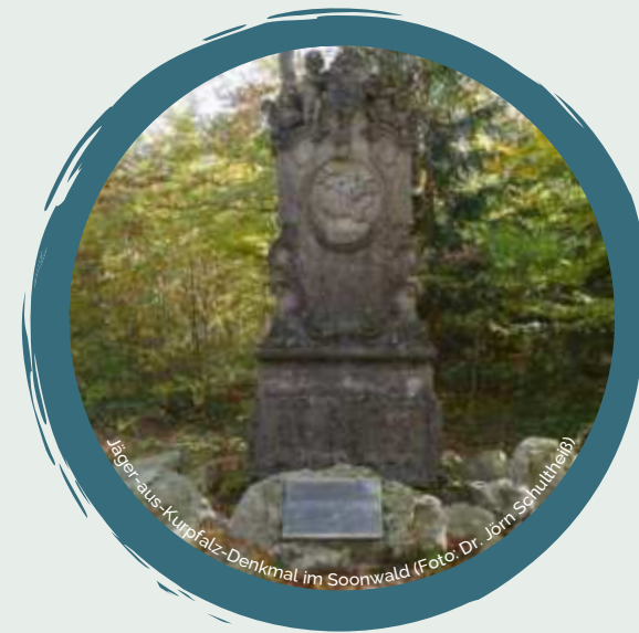
Jäger aus Kurpfalz-Denkmal im Soonwald