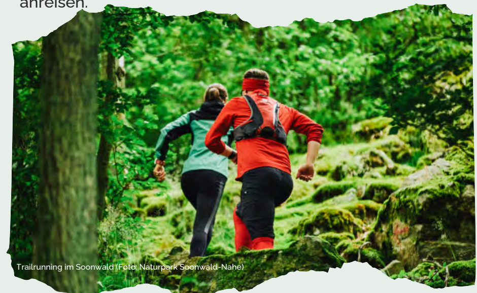
Trailrunning im Soonwald

für alle Tage die Verpflegung während der Veranstaltung (Mittagessen, Abendessen und Kaffeepausen). Die Rechnung erhalten Sie per E-Mail direkt nach der Anmeldung. Im Walderlebniszentrum sind kostenpflichtige Übernachtungen (inkl. Frühstück) für 51 € pro Nacht möglich. Mit einem Camper oder Zelt können sie kostenfrei übernachten. Bitte fragen Sie dazu frühzeitig unter Joern.Schultheiss@hs-gm.de an. Übernachtungsgäste können bereits einen Tag vor Beginn der Veranstaltung anreisen.